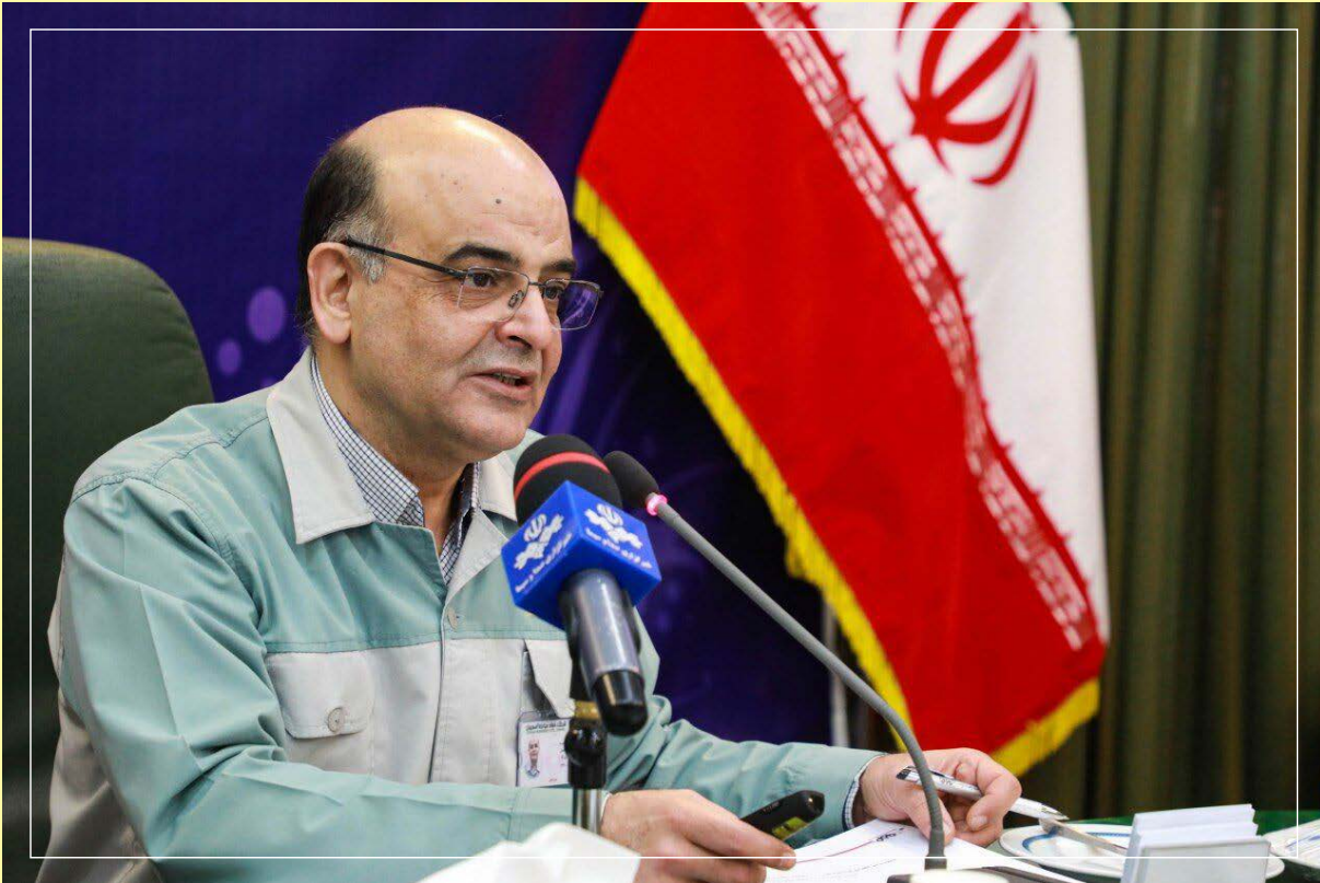
مدیرعامل شرکت فولاد مبارکه: