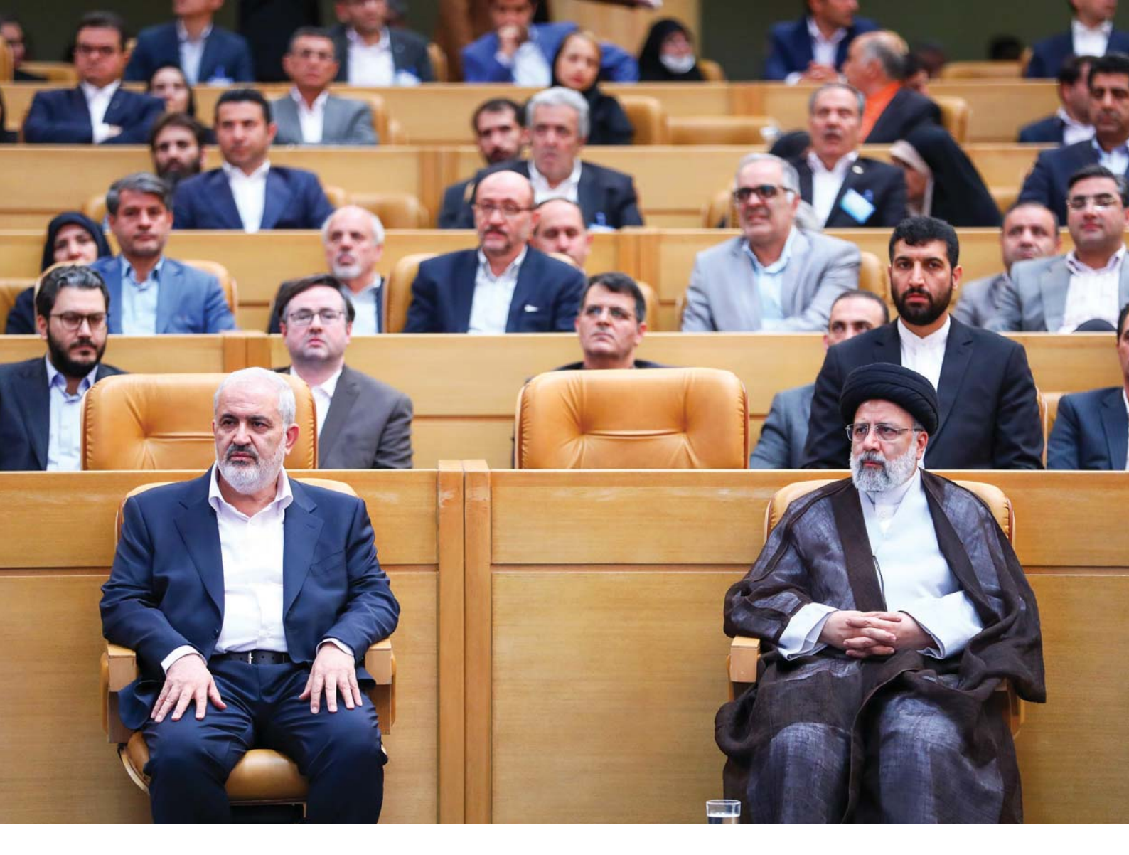
حجت الاسلام و المسلمين سيد ابراهيم رئيسي، رئيس جمهور در روز ملي صنعت و معدن: