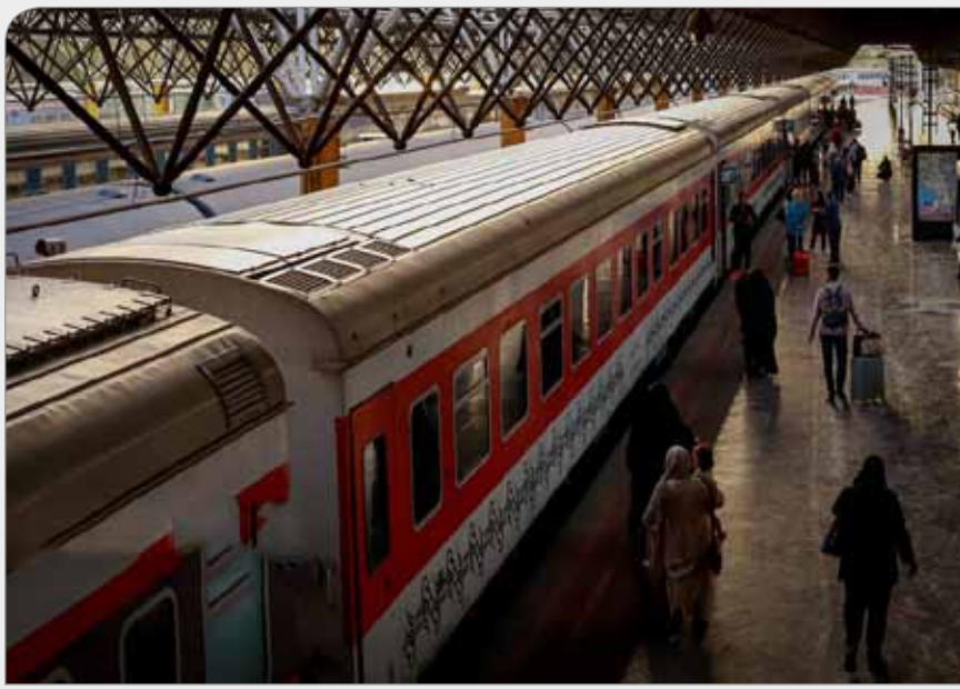
قطار مشهد؛ سفری آرام و دلپذیر، امن در مسیر خطوط ریلی

کل منطقه خلیج فارس را نشان می‌دهد. سختگویی وزارت خارجه همچنین ادعاهای مطرح‌شده در بیانیه مشترک شورای همکاری خلیج فارس - اتحادیه اروپایی راجع به توانمندی‌های دفاعی ایران را دخالتی ناپسند و غیرقابل‌قبول در امور تحت‌حاکمیت ملی ایران توصیف و خاطر نشان کرد. طرف‌هایی که از یک‌سو با خرید و فروش صدها میلیارد دلار انواع تسلیحات، منطقه‌ها را تبدیل به زرادخانه بزرگی از پیشرفته‌ترین سلاح‌های مغرب می‌کنند و از سوی دیگر، با بی‌عملی در قبال سیطره‌طلبی یک رژیم نسل‌کش و متجاوز با حمایت همه‌جانبه نظامی و سیاسی از آن منطقه غرب آسیا را در معرض جنگ‌های بی‌پایان قرار داده‌اند، به‌هیچ‌عنوان صلاحیت اظهار نظر درباره توانمندی‌های دفاعی درون‌زا و بومی ملت ایران ندارند. سختگویی وزارت امور خارجه با یادآوری بدعهدی‌ها و عملکرد ضعیف، غیرمستقل و فاقد حسن‌نیت ۳ کشور اروپایی عضو برجام که با سوءاستفاده از سازگار حل اختلاف برجام برای بازگرداندن قطعنامه‌های لغوشده شورای امنیت به‌اوج خود رسید، افزود: شرم‌آور است که طرف‌هایی که خود عامل بروز وضعیت فعلی هستند، اکنون خود را در جایگاه مدعی قرار داده‌اند. در عین حال تاسف‌بار است که کشورهای عضو شورای همکاری خلیج‌فارس به‌جای مطالبه‌گری از اتحادیه اروپایی در موضوعات مختلف مرتبط با منطقه غرب آسیا، محملی برای افرافتنی مزوره‌انه آنها فراهم کرده‌اند.